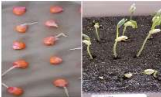
Gambar 1. Sampel uji daya kecambah dan uji daya tumbuh pada waktu pengamatan