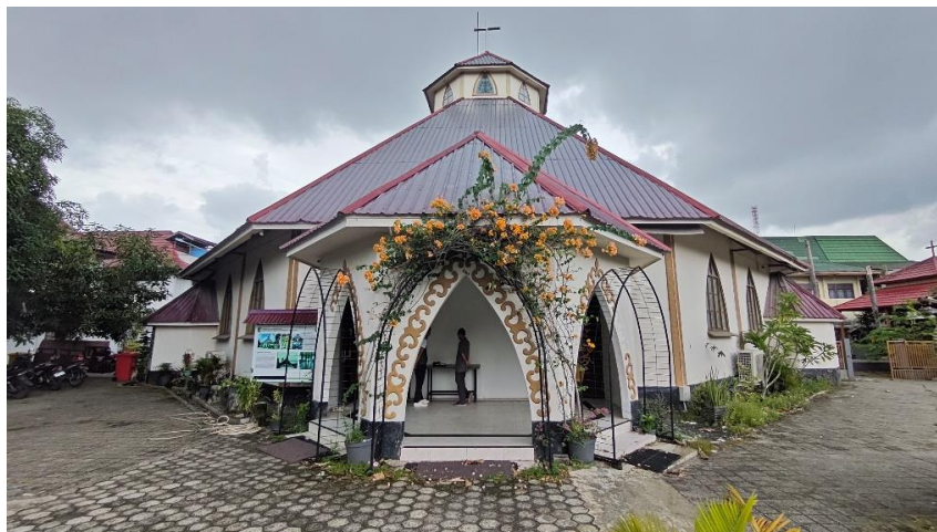
Gambar 1. Gedung Serba Guna Tjilik Riwut

di Jln. Tjilik Riwut Kota Palangka Raya. Dibawah ini merupakan lokasi penelitian yang terdapat pada gambar 1 sebagai berikut: