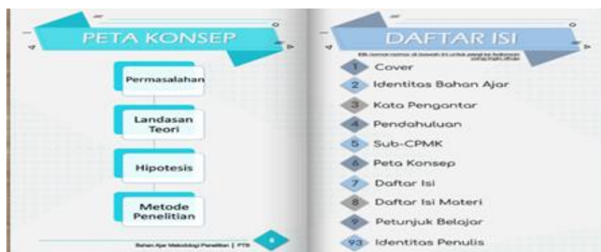
Gambar 2. Tampilan Peta Konsep dan Daftar Isi

Berikut adalah contoh tampilan modul elektronik yang telah dibuat.