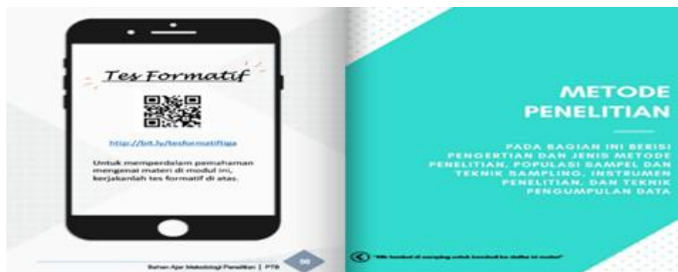
Gambar 4. Tampilan Tes Formatif