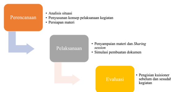
Gambar 1. Skema Metode Pelaksanaan Kegiatan

pemahaman peserta dan kebermanfaatan kegiatan.