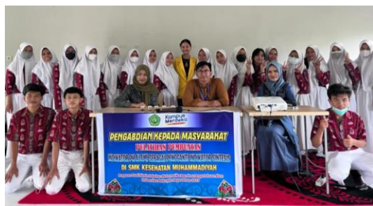
Gambar 2. Peserta Kegiatan

Peserta pengabdian kemudian diberikan pelatihan cara pengolahan kelopak bunga menjadi indikator pH alami. Agar memudahkan penggunaannya, dibuat bentuk indikator menyerupai kertas pH. Bentuk tersebut dipilih karena mudah dibuat dan relatif stabil dalam penyimpanan serta mudah untuk digunakan. Kegiatan kemudian dilanjutkan dengan sesi diskusi untuk memfasilitasi para peserta jika ada pertanyaan maupun memerlukan penjelasan lebih lanjut dari tema yang diberikan.