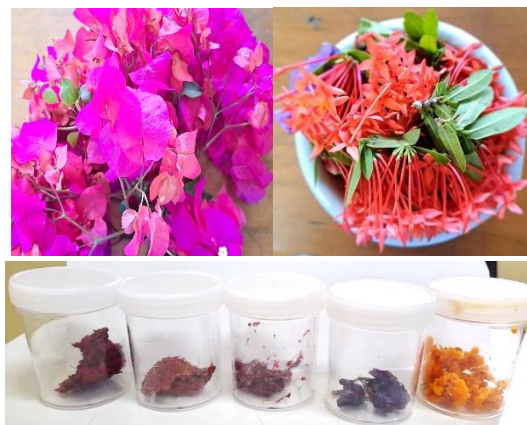
Gambar 2. Persiapan Bahan

gerusan kemudian dimaserasi menggunakan etanol. Proses maserasi minimal dilakukan selama 24 jam. Maserat kemudian dipisahkan dari ampas bunga. Kedalam larutan kemudian direndam kertas saring selama 1 jam. Setelah itu kertas saring dapat dikeringkan di suhu ruang. Kertas saring dapat dipotong sesuai kebutuhan jika ingin digunakan. Kertas pH dengan indikator alami tersebut akan memberikan warna berbeda sesuai dengan pH larutan yang diujikan.