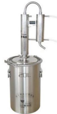
Gambar 1. Contoh Alat Destilasi

memberikan pelatihan bagi masyarakat desa dalam mengisolasi minyak atsiri menggunakan destilasi uap air (Gambar 1), yang sangat bermanfaat untuk menghasilkan minyak atsiri daun galem yang berfungsi sebagai pengusir lalat rumah.