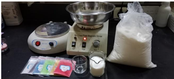
Gambar 5. Bahan Pembuatan Lilin

Lilin yang dihasilkan dapat dilihat pada gambar di bawah ini: