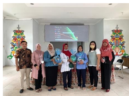
Gambar 8. Pemberian Hadiah