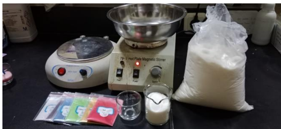
Gambar 5. Bahan Pembuatan Lilin

Lilin yang dihasilkan dapat dilihat pada gambar di bawah ini: