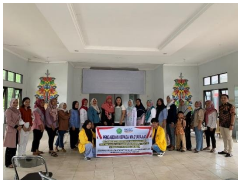
Gambar 9. Foto Bersama Tim dan Peserta

Secara umum, kegiatan PKM ini berlangsung dengan sukses, dan peserta berharap pelatihan dapat dilaksanakan secara berkelanjutan.