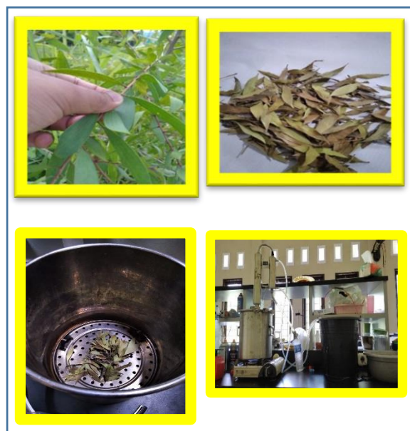
Gambar 3. Proses Pengambilan, Pengeringan, serta Destilasi Daun Galam

Tahap pelaksanaan dimulai pada minggu ke-3 Agustus 2022. Tahap ini dimulai dengan pengambilan daun tanaman Galam serta melakukan isolasi minyak atsiri daun tanaman Galam dengan menggunakan metode destilasi sederhana.