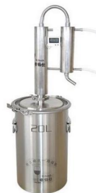
Gambar 1. Contoh Alat Destilasi

memberikan pelatihan bagi masyarakat desa dalam mengisolasi minyak atsiri menggunakan destilasi uap air (Gambar 1), yang sangat bermanfaat untuk menghasilkan minyak atsiri daun galem yang berfungsi sebagai pengusir lalat rumah.