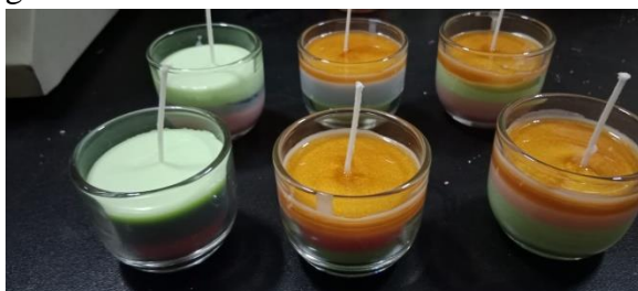
Gambar 6. Lilin yang dihasilkan

Lilin yang dihasilkan dapat dilihat pada gambar di bawah ini: