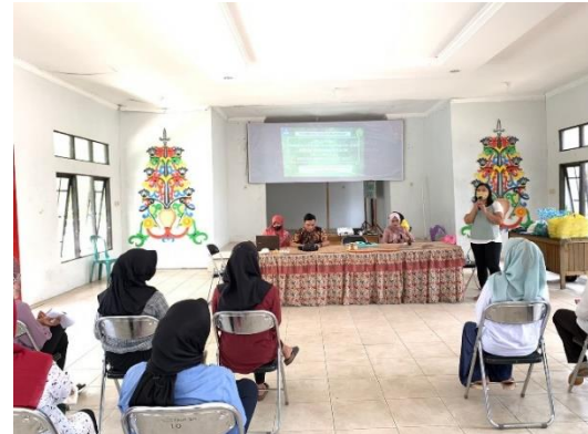
Gambar 7. Pelatihan Pembuatan Lilin

Pada jadwal yang telah ditetapkan, maka tim pelaksana melakukan pelatihan terhadap pembuatan lilin aromaterapi minyak atsiri daun tanaman galam. Pada tahap ini dilakukan dengan penjelasan mengenai tahapan pembuatan lilin dengan minyak atsiri daun galam.