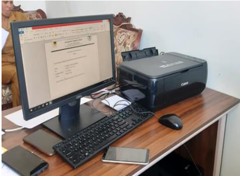
Gambar 1. Peralatan komputer dan printer pada Puskesmas Pakubaun Pemancar Jaringan Puskesmas Pakubaun