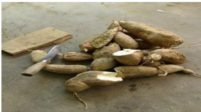
Gambar 1 Perajangan Singkong Secara Tradisional

Singkong dikenal juga dengan nama Ubi kayu ( Manihot esculenta ) merupakan tanaman tahunan yang tumbuh di wilayah tropis dan subtropis. Umbi tanaman ini dikenal luas sebagai sumber karbohidrat dan dijadikan sebagai makanan pokok di berbagai daerah, sementara daunnya sering dimanfaatkan sebagai sayuran. Daging umbi yang berwarna putih hingga kekuningan dapat diolah menjadi berbagai produk pangan, salah satunya adalah keripik, yang menjadi salah satu camilan populer di kalangan masyarakat Indonesia. Keripik sendiri merupakan jenis makanan ringan yang digemari secara luas, dengan beragam variasi seperti keripik buah, keripik singkong, keripik pisang, dan lain-lain. Di Indonesia, industri keripik berkembang pesat, mulai dari skala usaha kecil, menengah, hingga besar. Popularitas keripik yang tinggi serta ketersediaan bahan baku yang melimpah menjadi faktor utama pendorong pertumbuhan usaha di sektor ini. Gambaran di lapangan dapat dilihat pada gambar 1.