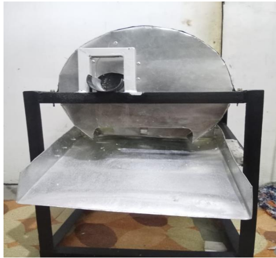
Gambar 4 Mesin Pengiris Singkong