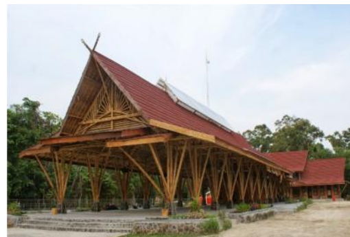
Gambar 6. Minim penggunaan dinding