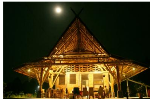
Gambar 5. Bukaan / Ventilasi

Penggunaan refrigeran tanpa ODP ( Ozone Depletion Potential ), tidak menggunakan bahan perusak ozon pada seluruh sistem penghawaan rumah bambu, karena hanya menggunakan penghawaan alami (pemanfaatan ventilasi serta meminimalisir penggunaan dinding).