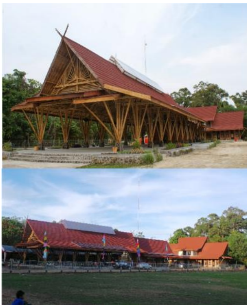
Gambar 2. Rumah bambu

Pembangunannya dikemas dengan cara pelatihan, sehingga masyarakat tidak hanya mendapatkan fasilitas Pusat Informasi Lestari, melainkan jauh lebih penting dari itu mereka mendapatkan keterampilan tentang perbambuan, mulai dari membudidayakan, mengawetkan, hingga memanfaatkannya untuk meubel dan konstruksi.