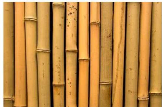
Gambar 3. Bambu

Bambu memiliki sejarah panjang dan mapan sebagai bahan bangunan di seluruh dunia baik di daerah tropis maupun sub-tropis. Menurut Sharma (1987) di dunia tercatat lebih dari 75 negara dan 1250 spesies bambu, bambu juga tumbuh melimpah di seluruh kepulauan Indonesia, dan telah menjadi bagian dari kehidupan masyarakat Indonesia selama berabad-abad. Pertumbuhan bambu yang cepat membuat bambu sebagai sumber daya yang dapat berkelanjutan. Bambu banyak digunakan untuk berbagai bentuk konstruksi bangunan, khususnya untuk perumahan di daerah pedesaan.