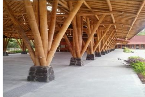
Gambar 4. Material bambu

Material ramah lingkungan, Bambu adalah tanaman yang paling cepat berkembang. Bambu menghasilkan oksigen yang lebih besar 30% dari pada hutan kayu pada wilayah yang sama.