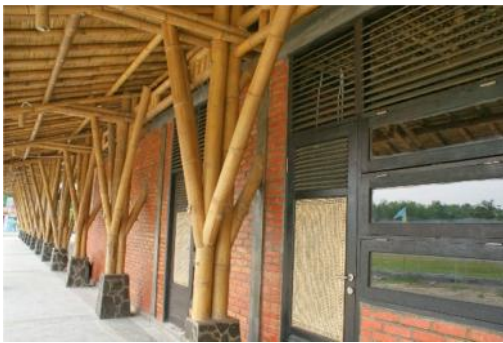
Gambar 7. Penerapan konstruksi modular

Material prafabrikasi, menggunakan desain modular sebesar +30% dari total material.