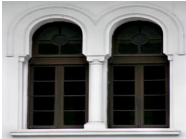
Gambar 6. Foto detail jendela Gedung Sate [7]

Jendela ini berbentuk seperti busur yang terbuat dari material bata plester yang condong ke arah luar dan dilengkapi dengan kaca berkusen kayu pada bagian dalamnya. Di sekeliling, bata plester ini diukir secara sederhana mengikuti bentuk busur jendela tersebut.