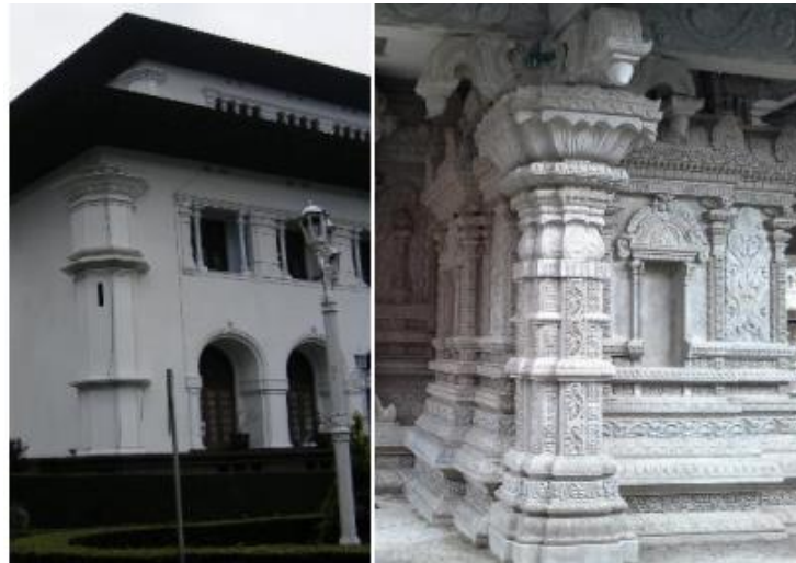
Gambar 3. Perbandingan tiang pada Gedung sate dengan tiang pada Kuil Sri Maha

Orientasi fasade Gedung Sate ternyata juga sangat diperhitungkan. Dengan mengikuti sumbu poros utara-selatan (yang juga diterapkan di Gedung Pakuan, yang menghadap Gunung Malabar di selatan), Gedung Sate justru sengaja dibangun menghadap Gunung Tangkuban Perahu di sebelah utara. Respon terhadap keberadaan Gunung Tangkuban Perahu ini merupakan salah satu hal yang patut mendapat apresiasi. Jadi Gedung Sate tidak hanya di desain secara sendiri namun juga memperhatikan lingkungan di sekitarnya.