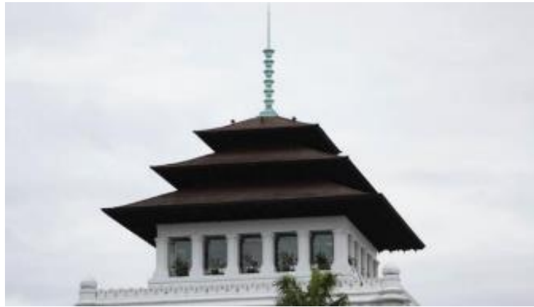
Gambar 5. Foto detail atap utama Gedung Sate [7]

yang sangat terkenal yaitu "tusuk sate" dengan 6 buah ornamen sate yang konon melambangkan 6 juta gulden (jumlah biaya yang digunakan untuk membangun Gedung Sate).