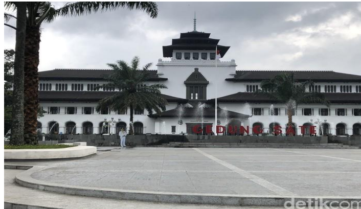
Gambar 1. Foto tampak depan Gedung Sate [7]

Dilihat dari tampak bangunannya, Gedung Sate memiliki tugas untuk mencerminkan kemegahan Bandung dalam desain arsitekturnya. Kesan megah sangat terlihat pada fasad Gedung ini, khususnya pada bagian Tengah fasad, terdapat suatu ornamen yang menyerupai bentuk candi yang kontras dan menarik. Bentuknya yang berundak menyerupai gunung ini disebut Kori Agung. Ornamen yang juga sering disebut dengan Paduraksa ini biasanya digunakan sebagai pembatas sekaligus gerbang akses penghubung antarkawasan dalam kompleks bangunan khusus. Ornamen yang kental dengan gaya arsitektur Hindu-Buddha ini sering dijumpai pada gerbang masuk bangunan-bangunan lama di Jawa dan Bali, seperti kompleks keraton, makam keramat, serta pura dan puri.