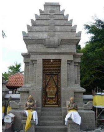
Gambar 2. Contoh Kori Agung pada Pura Gresik [8]

Dilihat dari tampak bangunannya, Gedung Sate memiliki tugas untuk mencerminkan kemegahan Bandung dalam desain arsitekturnya. Kesan megah sangat terlihat pada fasad Gedung ini, khususnya pada bagian Tengah fasad, terdapat suatu ornamen yang menyerupai bentuk candi yang kontras dan menarik. Bentuknya yang berundak menyerupai gunung ini disebut Kori Agung. Ornamen yang juga sering disebut dengan Paduraksa ini biasanya digunakan sebagai pembatas sekaligus gerbang akses penghubung antarkawasan dalam kompleks bangunan khusus. Ornamen yang kental dengan gaya arsitektur Hindu-Buddha ini sering dijumpai pada gerbang masuk bangunan-bangunan lama di Jawa dan Bali, seperti kompleks keraton, makam keramat, serta pura dan puri.