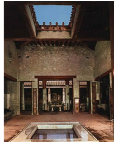
Gambar 4. Atrium dan Impluvium

Rumah bangsa Romawi memiliki interior yang mengikuti pola umum yang berlaku saat itu, yang dibagi menjadi beberapa bagian, yakni atrium sebagai central hall di dalam rumah yang memiliki bukaan atap berukuran besar (disebut compluvium ) dimana sinar matahari dapat masuk untuk menerangi bagian dalam rumah dan air hujan dibiarkan masuk yang kemudian ditangkap oleh kolam yang terletak dibagian tengah ruang (disebut impluvium ). Tamu memasuki atrium melalui selasar yang biasanya berhiasan mozaik pada lantainya. Tablium merupakan ruang suci yang terletak di ujung atrium . (Wealle, 1982:207).