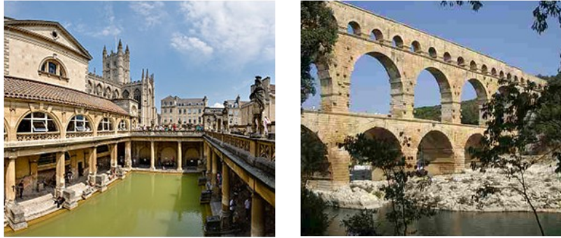
Gambar 2. Aquaduct dan Thermae