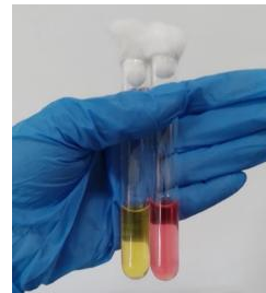
Gambar 13. Uji Karbohidrat

Diamati perubahan warna yang terjadi. Reaksi positif ditandai apabila terjadi perubahan warna menjadi kuning pada setiap media gula-gula, sedangkan reaksi negatif ditandai apabila media berwarna merah (tidak berubah warna) (Sulistiyono & Mutiara, 2023). Pada Gambar 13.