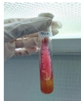
Gambar 2. Uji TSIA (Triple Sugar Iron Agar)

Berdasarkan hasil pengamatan pada Gambar 2. menunjukkan hasil uji TSIA pada bakteri kode sampel Ginjal bersifat A/K (Acid/Alkali) ditandai dengan warna merah pada Butt & kuning pada Slant dan bersifat H 2 S negatif ditandai dengan tidak timbulnya warna hitam serta gas negatif ditandai dengan terdapatnya gelembung gas.