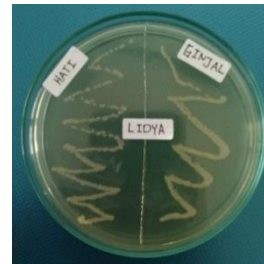
Gambar 18. Pemurnian Bakteri Pada Organ Target

Setelah melakukan pengamatan koloni bakteri, langkah selanjutnya adalah melakukan pemurnian dengan cara mengambil koloni target dari bakteri dan ditanam pada media TSA baru kemudian diinkubasi kembali selama 24 jam dengan suhu 28°C. Pemurnian bakteri yang dilakukan pada organ target berjumlah 2 pasang dan diberi kode sampel hati dan ginjal.