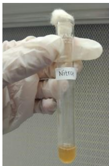
Gambar 11. Uji Nitrat

Berdasarkan hasil pengamatan pada Gambar 11. menunjukkan hasil uji Nitrat pada bakteri kode sampel Ginjal bersifat negatif ditandai dengan tidak terjadinya perubahan warna pada kultur.