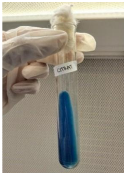
Gambar 4. Uji Citrat

Berdasarkan hasil pengamatan pada Gambar 4. menunjukkan hasil uji Citrat pada bakteri kode sampel Ginjal bersifat positif ditandai dengan warna biru pada Butt & Slant.