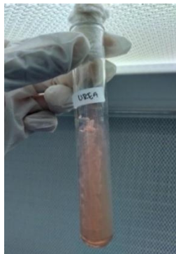
Gambar 5. Uji Urea

Berdasarkan hasil pengamatan pada Gambar 5. menunjukkan hasil uji Urea pada bakteri kode sampel Ginjal bersifat negatif ditandai dengan tidak terjadinya perubahan warna pada media.