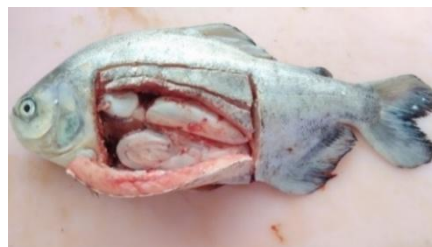
Gambar 1. Sampel Ikan Uji

Sampel ikan yang diuji adalah ikan bawal air tawar dalam keadaan hidup atau masih segar. Organ target yang diambil untuk pemeriksaan bakteri antara lain ginjal, hati dan jantung. Selanjutnya dilakukan nekropsi menggunakan alat bedah (gunting bedah, pisau bedah, pinset, jarum dissecting net) dan nampan bedah. Sebelum melakukan nekropsi, alat bedah yang akan dipakai disterilkan dengan alkohol 70%. Ikan ditusuk dengan jarum dissecting net di bagian kepala ikan hingga tembus mengenai medulla oblongata. Ditunggu beberapa menit hingga ikan benar-benar mati. Diamati kelainan patologis pada kedua sisi ikan setelah mati.