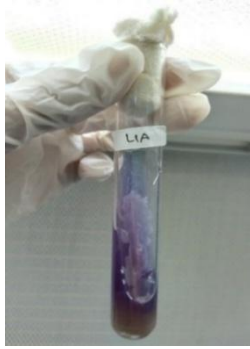
Gambar 3. Uji LIA (Lysine Iron Agar)

sampel Ginjal bersifat negatif ditandai dengan warna kuning pada Butt dan ungu pada Slant.