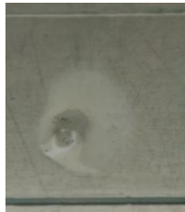
Gambar 16. Uji Katalase

Berdasarkan hasil pengamatan pada Gambar 16. menunjukkan bakteri pada kode sampel Ginjal bersifat positif ditandai dengan terbentuknya gelembung udara.