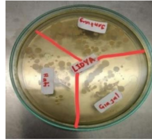
Gambar 17. Koloni Bakteri Pada Organ Target

pengamatan koloni bakteri yang tumbuh pada media TSA dapat dilihat pada Gambar 17.