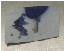
Gambar 15. Uji Oksidase

Berdasarkan hasil pengamatan pada Gambar 15. menunjukkan bakteri pada kode sampel Ginjal bersifat positif ditandai dengan perubahan warna ungu tua dalam kurun waktu 30 detik.