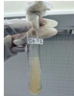
Gambar 7. Uji TSA 0% NaCl

Berdasarkan hasil pengamatan pada Gambar 7. menunjukkan hasil uji TSA 0% NaCl pada bakteri kode sampel Ginjal bersifat positif ditandai dengan pertumbuhan bakteri pada media.