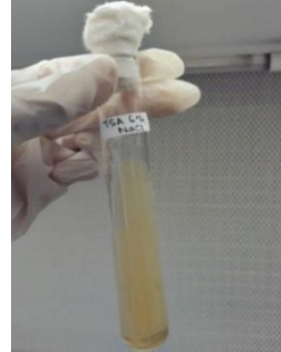
Gambar 6. Uji TSA 6% NaCl

Berdasarkan hasil pengamatan pada Gambar 6. menunjukkan hasil uji TSA 6% NaCl pada bakteri kode sampel Ginjal bersifat negatif ditandai dengan pertumbuhan bakteri pada media.