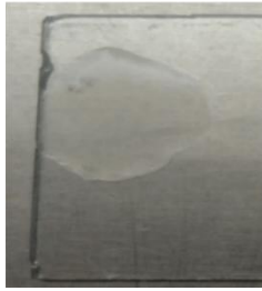
Gambar 14. Uji Gram KOH 3%