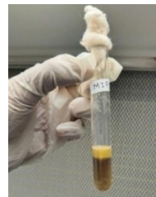
Gambar 8. Uji MIO ( Motility Indol Ornithin )

Berdasarkan hasil pengamatan pada Gambar 8. menunjukkan hasil uji Motility pada bakteri kode sampel Ginjal bersifat negatif ditandai dengan pertumbuhan bakteri yang tidak menyebar dan media tetap transparan. Hasil uji Indol pada bakteri kode sampel Ginjal bersifat negatif ditandai dengan reagen indol tetap berwarna kuning. Hasil uji Ornithin pada bakteri kode sampel Ginjal bersifat negatif ditandai warna kuning pada media.