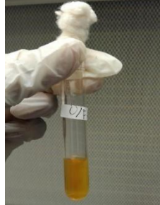
Gambar 9. Uji Oxidatif Fermentatif (O/F)

Berdasarkan hasil pengamatan pada Gambar 9. menunjukkan hasil uji O/F pada bakteri kode sampel Ginjal bersifat Fermentatif ditandai dengan adanya perubahan warna hijau ke kuning pada tabung dengan paraffin.