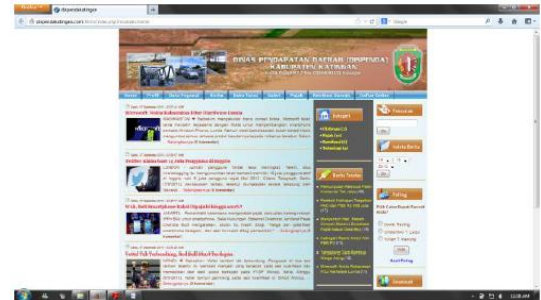
Gambar 3. Tampilan halaman Home menggunakan browser Mozilla Firefox

Pengujian secara online dilakukan untuk mengetahui apakah website yang sudah dihosting berjalan sesuai dengan desain yang dibuat dan untuk mengetahui apakah semua fungsionalitas dari sistem sudah sesuai dan berfungsi dengan benar. Website dapat diakses di www.dispendakatingan.com/html