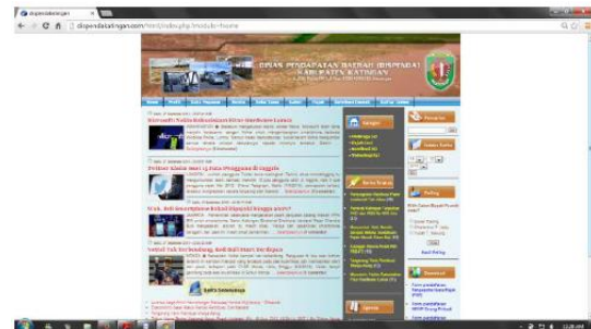
Gambar 4. Tampilan halaman Home menggunakan browser Google Chrome