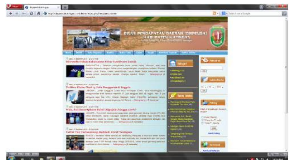
Gambar 5. Tampilan halaman Home menggunakan browser Opera

Setelah dilakukan pengujian secara online dapat disimpulkan bahwa: