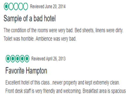
Gambar 1. Customer Reviewer terhadap kamar hotel pada website www.tripadvisor.com .

polaritas dari dari opini yang direpresentasikan oleh publik dalam bentuk teks di media online. Kerangka kerja opinion mining yang dirancang pada penelitian ini menggunakan pendekatan berbasis lexical.