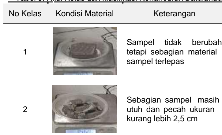
Tabel 3. Nilai Kelas dan klasifikasi Kehancuran Batulanau

pada Tabel 3. Berdasarkan nilai kelas dan klasifikasi slaking indeks, nilai slaking indeks diartikan sebagai tingkat kehancuran batuan, yang berarti semakin tinggi persentase nilai indeks slaking (Is) semakin tinggi pula tingkat kehancurannya seperti yang diperlihatkan pada Tabel 3.