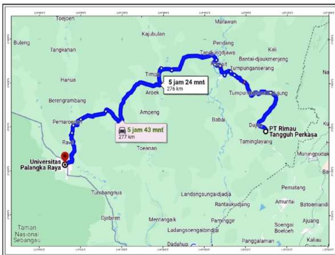
Gambar 1. Kesampaian Daerah Penelitian