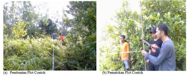
Gambar 2. Aktivitas Pembuatan Plot Contoh