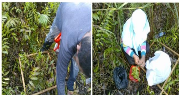
(a) Penempatan kuadran kayu (b) Proses pemisahan daun & batang tumbuhan bawah

Pengambilan contoh biomassa tumbuhan bawah harus dilakukan dengan metode destructive (merusak bagian tanaman). Tumbuhan bawah yang diambil sebagai contoh adalah semua tumbuhan hidup berupa pohon yang berdiam < 5 cm, herba dan rumput-rumputan.