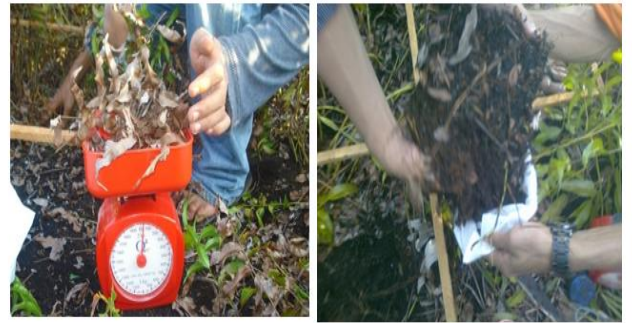
(a) Pengukuran Serasah Kasar