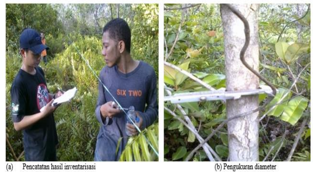
Gambar 3. Pengukuran Biomassa Vegetasi (D = 5 - 30 cm)

Inventarisasi dilakukan dengan mencatat nama setiap vegetasi, kemudian mengukur diameter batang setinggi dada (dbh = diameter at breast height = 1,3 m dari permukaan tanah). Pengukuran dbh hanya pada vegetasi dengan diameter < 5 - 30 cm dan > 30 cm (jika ada).