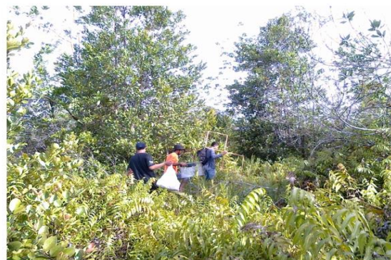
Gambar 8. Stenochlaena palustris Burm & Blachnum indicum Menutupi Hampir Seluruh Permukaan Lahan

Dalam pengamatan jenis vegetasi berdiameter < 5 cm ini, tidak dilakukan perhitungan jumlah jenis yang ditemukan pada plot contoh (PC). Namun hanya mengambil sampel pada setiap kuadran yang telah ditentukan. Jenis vegetasi yang sangat dominan tumbuh di lahan bekas kebakaran yaitu Stenochlaena palustris Burm. yang dikenal oleh suku Dayak Kahayan dengan nama "Kelakai" dan Blachnum indicum yang juga dikenal termasuk tumbuhan pakis-pakistan. Jenis ini menutupi hampir seluruh permukaan lahan, bahkan tumbuh di atas genangan.