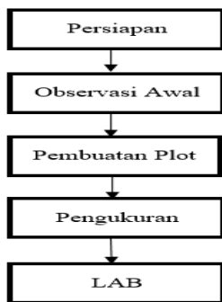
Gambar 1. Bagan Alur Penelitian

Metode yang digunakan adalah metode standar yang digunakan oleh kelompok peneliti yang bergabung dalam jaringan International Alternative to Slash and Burn (ASB) . Penelitian ini ditekankan pada perhitungan kandungan biomassa tumbuhan bawah dan nekromassa tumbuhan yang berada di atas permukaan tanah, dan kemudian diestimasi untuk menentukan jumlah C tersimpan yang terdapat pada lokasi penelitian. Tahapan-tahapan dalam pelaksanaan penelitian ini adalah sebagai berikut :