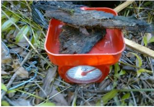
Gambar 6. Pengukuran Nekromassa Berkayu