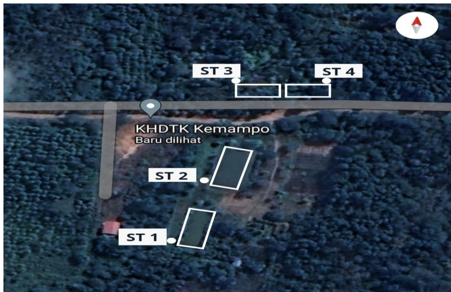
Gambar 1. Peta Lokasi Pengambilan Sampel

Sampel diambil di Kawasan Hutan Dengan Tujuan Khusus (KHDTK) Kemampo, Desa Kayuara Kuning, Kecamatan Banyuasin III, Kabupaten Banyuasin, Provinsi Sumatera Selatan. Penelitian ini dilaksanakan pada bulan September 2023. Sampel air diambil dari 4 stasiun (Gambar 1). Parameter yang diukur untuk pemeriksaan kualitas air, yaitu parameter biologi dengan menggunakan metode Most Probable Number (MPN) yang merupakan metode untuk mendeteksi dan menghitung jumlah bakteri Coliform dan Colifecal . Metode MPN yang digunakan yaitu ragam 555 (5 x 10 mL, 5 x 1 mL, 5 x 0,1 mL). Parameter fisika yang diukur secara in-Situ (di lapangan) yaitu pengukuran suhu, warna dan bau. Parameter kimia yaitu pH, Cd, Pb, Fe, dan Cu menggunakan Spektrofotometer Serapan Atom (SSA). Parameter kimia dan biologi dianalisis di Laboratorium Terpadu UIN Raden Fatah Palembang.