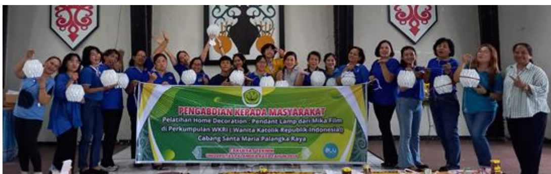
Gambar 4. Foto bersama setelah kegiatan usai

Dalam keseluruhan pelaksanaan kegiatan ini, peserta mampu mengikuti dan berhasil membuat pendant lamp, sedikit kendala karena tingkat kesulitan yaitu pada saat pengukuran pola dan pembentukan mika film menjadi kelopak.