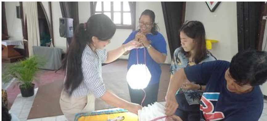
Gambar 3. Tes nyala lampu

Sementara menunggu lem mengering, dirangkailah kabel, steker, rumah lampu dan bohlamp dimana sebelumnya stoples sudah dilubangi, setelah semua jaringan lampu ke listrik terpasang, dilakukanlah tes menyambungkan ke aliran listrik, untuk memastikan lampu menyala atau tidak. Bagian terakhir, adalah melepas ikatan tali, dan Lampu pendant dari mika film dengan bentuk seperti bunga ini sudah selesai dan bisa dipasang dirumah sebagai dekorasi ruangan.