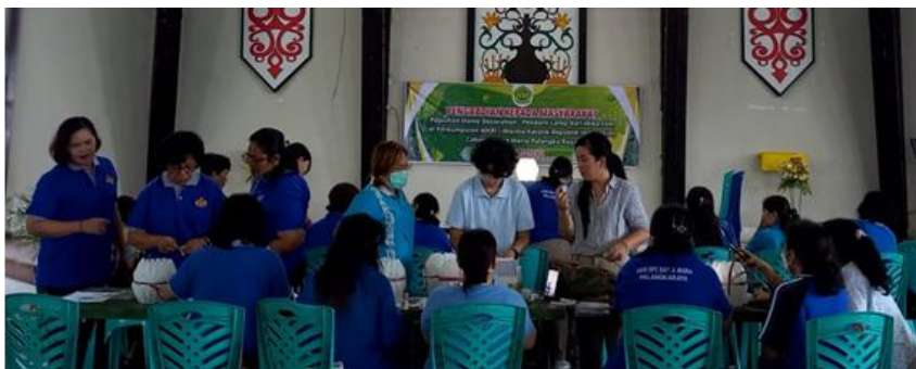
Gambar 4. Suasana Kegiatan