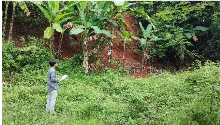
Gambar 3. Observasi dan Survei Mitra

Berdasarkan diskusi dengan pengelola pondok, pada Gambar 4 terungkap bahwa kurangnya tenaga kerja dan dana merupakan kendala utama dalam upaya mengurangi risiko tanah longsor (Fajarulloh et al., 2020). Oleh karena itu, bantuan teknis diperlukan untuk menyiapkan desain awal dinding penahan (DPT) sebagai solusi awal (Setyowati et al., 2024; Zamroni et al., 2023).