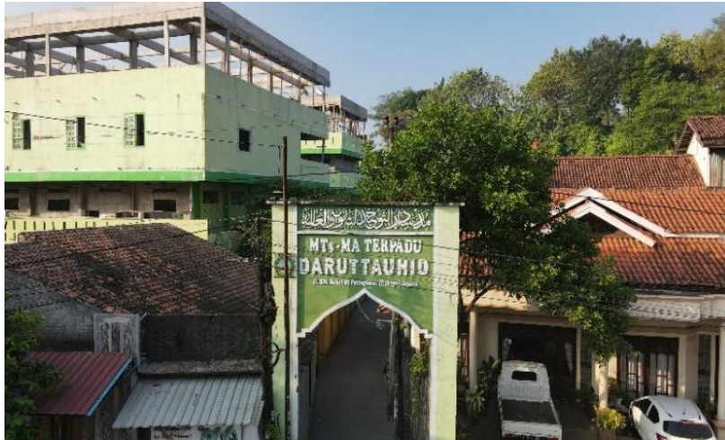
Gambar 2. Tampak Depan Gerbang Sekolah Pesantren Daruttauhid

al., 2025). Konsekuensinya bisa sangat merusak, termasuk kerusakan bangunan dan infrastruktur serta risiko kehilangan nyawa, terutama di daerah dengan kepadatan penduduk tinggi atau dekat fasilitas umum seperti sekolah dan tempat ibadah (Adfy et al., 2021; Prastika et al., 2025).