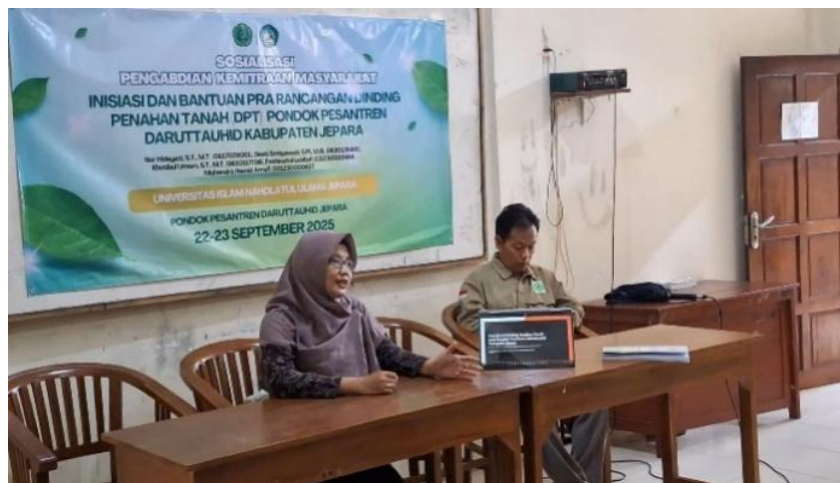
Gambar 6 Sosialisasi dengan pengelolaan Pondok Pesantren Daruttauhid