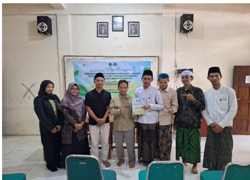
Gambar 7: Penyerahan draf DPT kepada manajemen Pesantren Daruttauhid