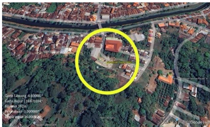
Gambar 1. Lokasi Pesantren Daruttauhid

Indonesia merupakan salah satu negara dengan tingkat kerentanan yang tinggi terhadap bencana geologi, khususnya tanah longsor. Geografi perbukitan dan curah hujan yang tinggi menjadikan tanah longsor sebagai ancaman serius terhadap keberlanjutan infrastruktur dan keselamatan publik (Adfy et al., 2021; Hidayati & Yustianingsih, 2019; Tampubolon et al., 2022). Pondok Pesantren Daruttauhid Jepara terletak di Jl. KM. Sukri No. 99 Potroyudan, Jepara. Kondisi geografis sekolah cukup ekstrem, karena terletak di bawah tebing, sekitar 3 Meter dari tebing. Tebing tersebut memiliki kemiringan yang curam, dengan total ketinggian sekitar 14 meter, sehingga rawan tanah longsor. Dampak hujan lebat di daerah tersebut dapat menyebabkan tanah longsor dan erosi lereng (Adfy et al., 2021). Dilihat dari kondisi geografisnya, Pondok Pesantren Daruttauhid merupakan daerah rawan tanah longsor ( Gambar 1 ). Tanah longsor ini telah terjadi sekali, pada tanggal 17 Maret 2024, menyebabkan sebagian bangunan Pondok Pesantren tersebut runtuh.