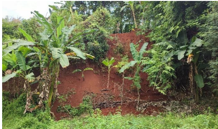
Gambar 4. Kondisi lahan miring yang ada di Pesantren Islam Daruttauhid

Berdasarkan diskusi dengan pengelola pondok, pada Gambar 4 terungkap bahwa kurangnya tenaga kerja dan dana merupakan kendala utama dalam upaya mengurangi risiko tanah longsor (Fajarulloh et al., 2020). Oleh karena itu, bantuan teknis diperlukan untuk menyiapkan desain awal dinding penahan (DPT) sebagai solusi awal (Setyowati et al., 2024; Zamroni et al., 2023).