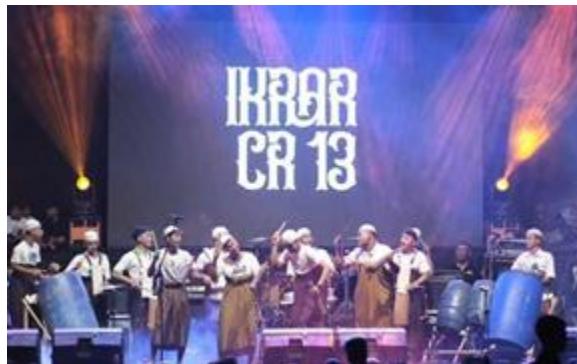
Gambar 2. Penampilan Seluruh Kegiatan Kesenian Musik Tradisional Tongtek.