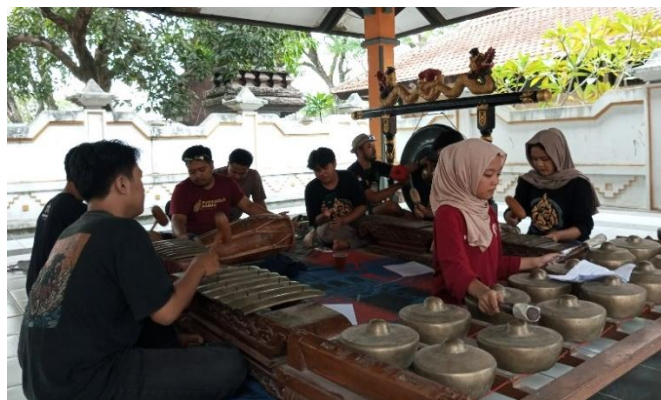
Gambar 8. Kolaborasi gamelan reog dan gamelan ageng.

Dalam dinamika proses kreatif dan pengembangan karya, Larastika Larang tidak terlepas dari berbagai tantangan nyata yang dihadapi di lapangan. Salah satu tantangan utama adalah rendahnya minat sebagian masyarakat Ponorogo, khususnya generasi muda, terhadap kesenian tradisional. Banyak di antara mereka lebih akrab dan tertarik pada musik modern, sehingga kesenian lokal kerap kali dianggap usang atau kurang relevan dengan zaman. Selain itu, persoalan pendanaan turut menjadi hambatan tersendiri. Keterbatasan dana dalam proses produksi dan latihan membuat tim kreatif harus berinovasi dengan sumber daya yang ada, tanpa mengorbankan kualitas artistik karya. Masalah teknis lainnya juga muncul dalam bentuk keterbatasan fasilitas, baik ruang latihan maupun alat pertunjukan yang harus melalui prosedur administratif cukup rumit untuk dapat digunakan. Dalam beberapa kasus, penjadwalan latihan juga mengalami kendala akibat padatnya agenda para penari dan pemusik yang terlibat dalam berbagai kegiatan seni lainnya, sehingga koordinasi menjadi tidak selalu mudah.