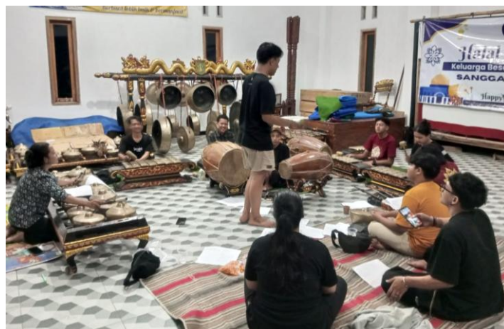
Gambar 5. Latihan Pengiring Musik Sendratari Larastika Larang.