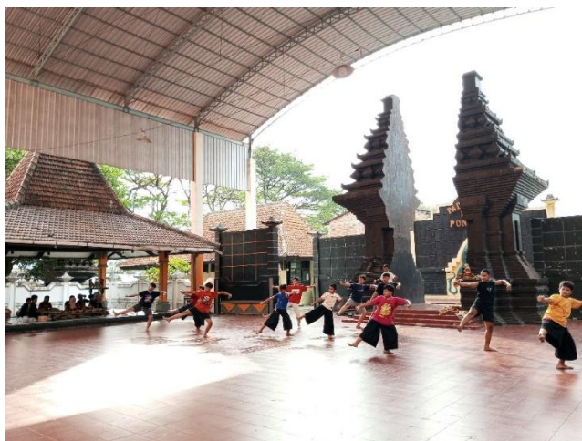
Gambar 4. Latihan Sendratari Larastika Larang.

Pertunjukan ini diawali dengan adegan bertajuk Tari Gunungan, yang dibawakan oleh sepuluh penari. Dalam tradisi pewayangan, gunungan selalu diletakkan di awal cerita sebagai simbol pembuka kehidupan. Di panggung Larastika Larang, tari ini menjadi lambang dimulainya kisah tentang wastra atau kain batik sebagai identitas budaya masyarakat Ponorogo. Iringan musik sigrak dengan gaya Solonan yang enerjik turut memperkuat atmosfer pembuka, menciptakan kesan semangat, kesiapan, dan harapan dalam memasuki dunia batik yang sarat makna. Cerita kemudian berlanjut ke dalam adegan Kerakyatan yang melibatkan dua puluh penari. Adegan ini memotret kehidupan masyarakat Ponorogo dalam suasana yang harmonis dan produktif. Gerakan tari yang bumi menampilkan aktivitas sehari-hari seperti bertani, membatik, dan interaksi sosial yang akrab. Keceriaan kolektif ditampilkan sebagai bentuk keseimbangan hidup antara manusia dan budaya. Musik pengiring menyuguhkan nuansa gembira dan dinamis, merepresentasikan semangat kerakyatan yang adil dan beradab, sebuah suasana yang dalam bahasa lokal disebut sueeneng puol , penuh sukacita dan kedekatan emosional antarwarga.