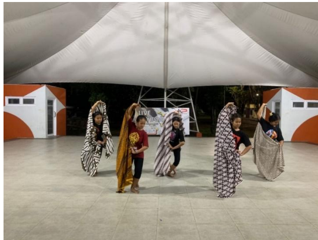
Gambar 9. Tari Batik Ponoragan.

Karya ini pun memiliki potensi untuk menjangkau ranah yang lebih luas. Di tingkat lokal, Larastika Larang berpeluang besar untuk ditampilkan dalam berbagai kegiatan budaya seperti festival daerah, peringatan hari jadi Ponorogo, hingga program edukatif berbasis seni di sekolah-sekolah. Di sana, karya ini dapat berfungsi sebagai media penguatan nilai-nilai kultural masyarakat. Bahkan, Hasbi berharap agar karya ini mampu mendorong perhatian pemerintah daerah dalam menetapkan batik Ponorogo sebagai warisan budaya yang dilindungi secara hukum melalui hak cipta. Di tingkat global, Larastika Larang mengangkat isu pelestarian budaya di tengah arus modernisasi merupakan isu yang relevan secara universal. Dengan pengemasan pertunjukan yang profesional dan dokumentasi yang representatif, karya ini memiliki peluang untuk menjadi bagian dari diplomasi budaya Indonesia. Sejalan dengan pengakuan UNESCO terhadap batik sebagai warisan budaya dunia, pertunjukan ini membuka ruang bagi Batik Ponorogo untuk dikenal secara internasional.