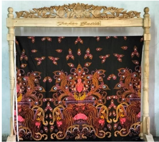
Gambar 2. Motif Batik Reog Ponorogo.

interdisipliner yang kreatif, karya ini menjadi bukti konkret bagaimana seni pertunjukan dapat menjadi sarana penguatan budaya.