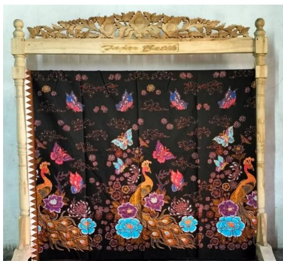
Gambar 1. Motif Batik Merak Ponorogo.

Namun, memasuki dekade 1980-an, industri batik mulai mengalami kemunduran drastis akibat krisis bahan baku, lemahnya permodalan, munculnya batik printing, dan tidak adanya regenerasi perajin yang berkelanjutan (Safitri, A. F. R., Subagyo, 2015). Bahkan pada awal 2000-an, hanya segelintir pengrajin seperti Hj. Marianah dan Hindarti Rusdi yang masih bertahan dalam produksi batik tulis secara rumahan. Kondisi ini diperburuk oleh rendahnya minat masyarakat lokal terhadap produk batik Ponorogo, yang dianggap mahal dan kurang praktis dibanding batik dari daerah lain seperti Pekalongan dan Solo (Safitri, A. F. R., Subagyo, 2015). Dari sisi sosio-kultural, batik Ponorogo juga belum sepenuhnya melekat dalam kesadaran masyarakat sebagai simbol identitas kedaerahan. Banyak warga Ponorogo yang bahkan tidak mengetahui bahwa daerahnya memiliki tradisi batik yang kuat. Rendahnya promosi, minimnya edukasi budaya di lingkungan sekolah, serta belum optimalnya peran pemerintah daerah dalam mendukung industri kreatif turut menjadi penyebab lemahnya posisi batik dalam ranah budaya lokal (Zainudin et al., 2022)