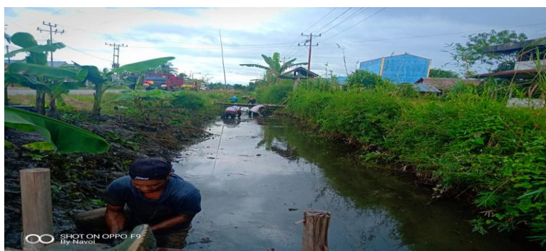
Gambar 5. Kegiatan Gotong Royong Dalam Pembersihan Sungai Di Desa Bekut.

dominan ke salah satu indikator nilai karakter peduli lingkungan yakni sadar akan lingkungan yang sehat karena hal tersebut. Didesa bekut bahwa kgiatan tersebut dapat berfungsi sebagai alat yang efektif untuk menyebarkan pesan-pesan edukatif mengenai pentingnya menjaga kebersihan lingkungan, mengurangi sampah plastik, merawat flora dan fauna, serta memanfaatkan sumber daya alam secara bijak. konten-konten positif yang ada di TikTok, seperti kampanye kebersihan, penghijauan, serta pengelolaan sampah, mendorong remaja untuk lebih peduli terhadap lingkungan mereka.