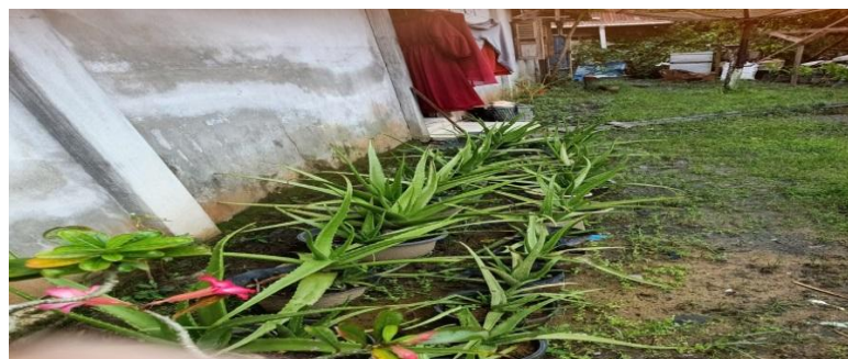
Gambar 3. Tanaman salah satu warga di desa Bekut yakni lidah buaya.

Melalui video-video edukatif dan kampanye yang disebar, TikTok berhasil membentuk kesadaran kolektif di kalangan remaja tentang pentingnya peduli terhadap lingkungan dan sosial. Remaja yang awalnya kurang peduli terhadap isu-isu tersebut menjadi lebih termotivasi untuk terlibat dalam gotong royong, penanaman pohon, dan pengelolaan sampah. Media sosial ini tidak hanya memengaruhi sikap remaja, tetapi juga