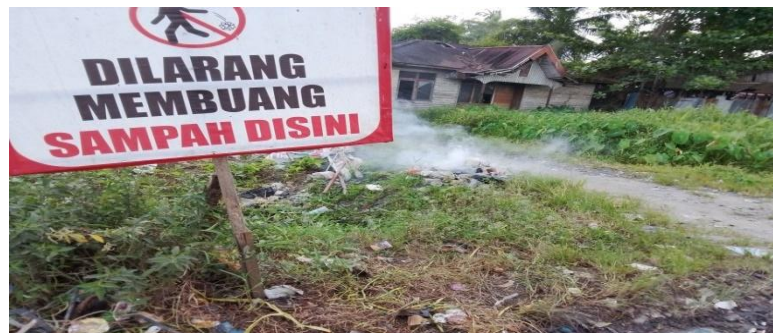
Gambar 2. Tanda dilarang buang sampah sembarangan.