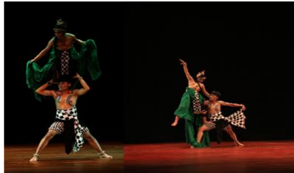
Gambar 1. Akrobatik pose bertingkat pada bagian peperangan Naga dan Bima dalam karya Abhimantra.

idiom tari perangan gaya Surakarta. Gerak cepat ini dihadirkan untuk menunjukkan bahwa peperangan masih terjadi di permukaan air laut. Oleh karena itu masih digunakan gerak-gerak peralihan dengan lompatan-lompatan, akrobatik pose bertingkat dan perpindahan penari yang lebih dinamis.