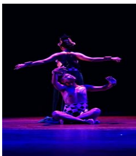
Gambar 4. Gerak gelombang yang dilakukan duet antara tokoh Naga dan Bima dalam karya tari Abhimantra.