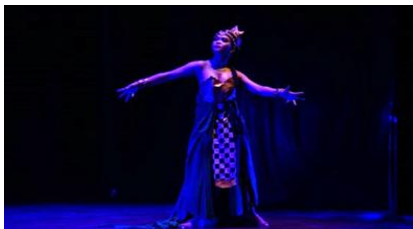
Gambar 3. Gerak gelombang tangan untuk gerak dasar karakter tokoh Naga dalam karya Abhimantra.

perlahan, dan mengalun. Proses dalam menciptakan sebuah komposisi tari dengan syarat-syarat pokok yang disatukan dengan aspek-aspek tari yaitu gerak, ruang dan waktu.