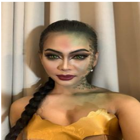
Gambar 2. Tata rias dan Busana Tokoh Naga dalam karya tari Abhimantra.

Abhimantra digunakan rias fantasi dan modifikasi busana yang bersumber dari tata busana tari gaya Surakarta dengan mengeksplorasi penambahan kain panjang hijau sebagai ekor dan kain poleng (hitam-putih). Penghadiran kain poleng sebagai bagian dari tata busana kedua tokoh, juga bermaksud untuk memunculkan bagian kecil dari identitas budaya Bali sebagai tempat pelaksanaan pementasan. Sementara tata rias pada karya Abhimantra adalah rias fantasi dimana make up yang digunakan make up cantik, tajam dan pada bagian wajah sebelah kanan ditambah lukisan sisik warna hijau berfungsi sebagai penegasan pada rias dan karakternya.