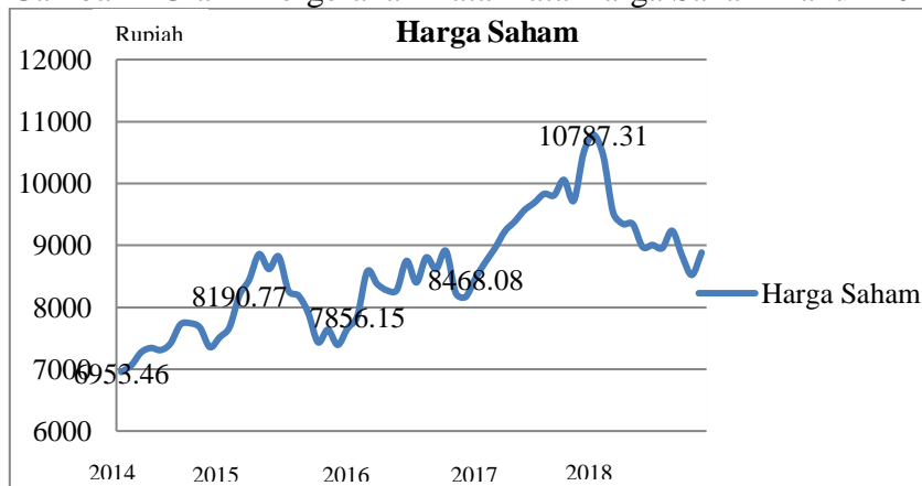
Gambar 1 Grafik Pergerakan Rata-Rata Harga Saham Tahun 2014-2018