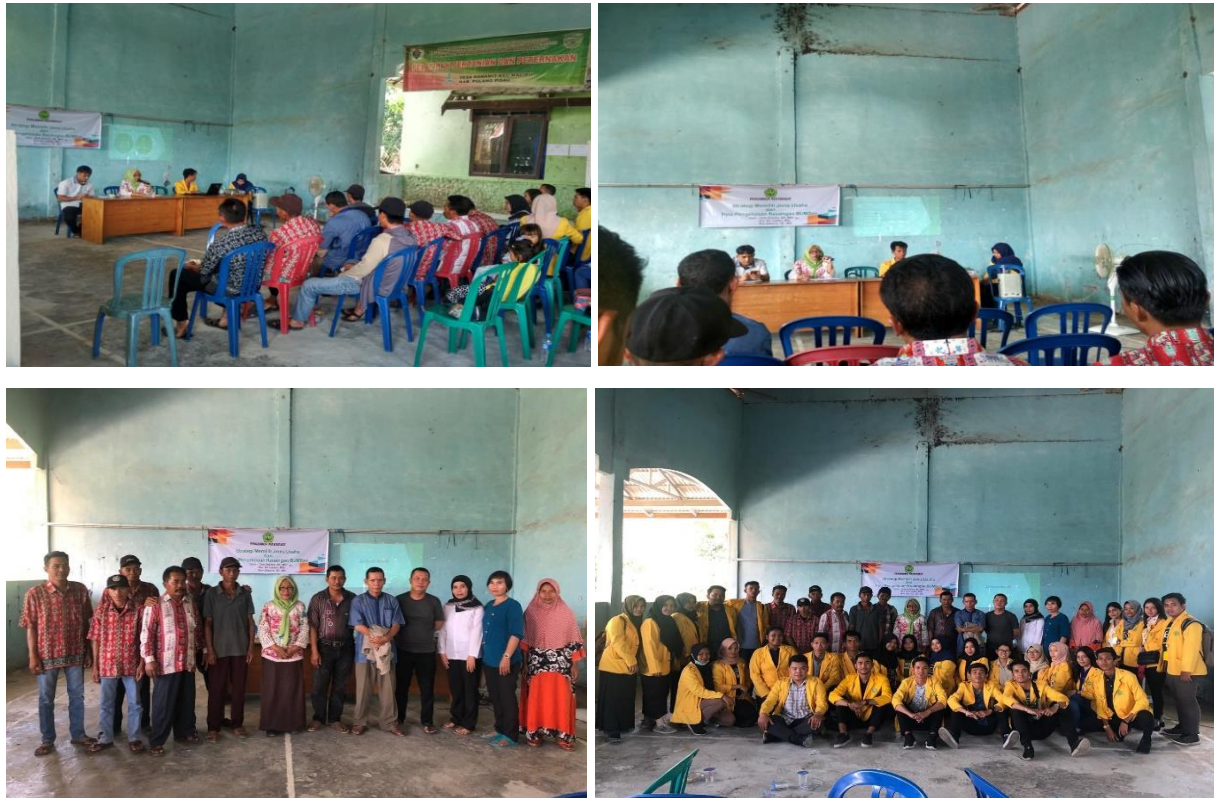
Gambar 2. Sosialisasi bersama Kepala Desa dan Pengurus BUMDes

Metode Analisis WOTS-UP: Metode analisis ini merupakan modifikasi dari analisis SWOT dimana dapat diperoleh hasil sbb: