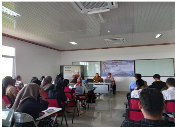
Gambar 1. Pelaksanaan Penyampaian Materi tentang Maksud dan Tujuan PKM

untuk mencegah plagiarisme adalah dengan menuliskan sumber dari tulisan yang dikutip baik secara sebagian atau keseluruhan pada daftar pustaka. Penggunaan aplikasi Mendeley dalam hal ini akan sangat membantu peserta untuk meminimalisir tindakan plagiarisme dikalangan mahasiswa.