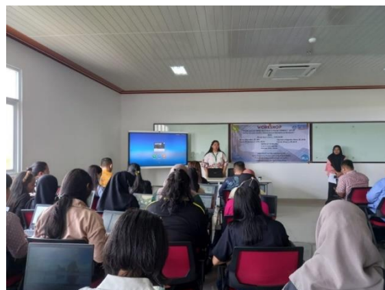
Gambar 2. Pelaksanaan Penyampaian Materi Tentang Etika Publikasi ilmiah dan Plagiarisme

Setelah peserta memahami maksud dan tujuan serta menyadari pentingnya mengikuti kegiatan yang diselenggarakan khususnya untuk meminimalisir adanya plagiarisme dikalangan mahasiswa, tim PkM menyampaikan materi selanjutnya tentang pengenalan aplikasi Mendeley. Berdasarkan hasil wawancara tim PkM dengan semua peserta kegiatan, diperoleh informasi bahwa sangat minim pengetahuan mahasiswa tentang aplikasi Mendeley. Mendeley merupakan sebuah aplikasi dalam