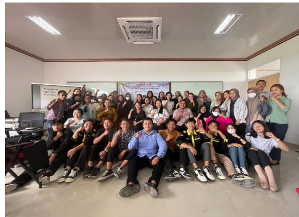
Gambar 6. Pelaksanaan Bimbingan dan Praktik Aplikasi Mendeley

Peserta kegiatan PkM terlihat sangat antusias mengikuti dan menyimak materi yang diberikan, hal ini ditunjukkan dengan keaktifan peserta untuk bertanya dalam melakukan instalasi dan menggunakan aplikasi Mendeley dalam Ms. Word.