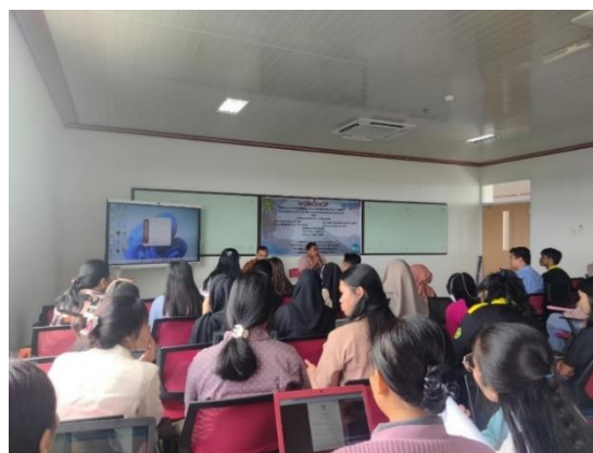
Gambar 4. Pelaksanaan Penyampaian Materi Tentang Pengenalan Aplikasi Mendeley

Tim PkM melanjutkan kegiatan dengan agenda penyampaian materi selanjutnya yakni cara menggunakan aplikasi mendeley pada laptop atau Ms. Word. Secara teknis langkah-langkah menggunakan mendeley adalah sebagai berikut: