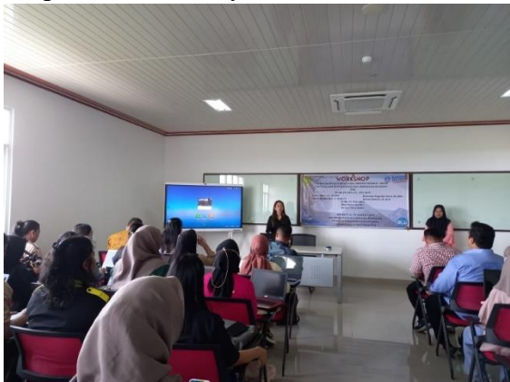
Gambar 3. Pelaksanaan Penyampaian Materi Tentang Pengenalan Aplikasi Mendeley

mengelola referensi sehingga dapat memudahkan penulis dalam mengelola referensi atau literatur. Dengan menggunakan Mendeley mahasiswa dapat mengelola referensi-referensi tulisan dengan mudah. Selain itu tim PkM juga menunjukan web resmi dari aplikasi Mendeley.