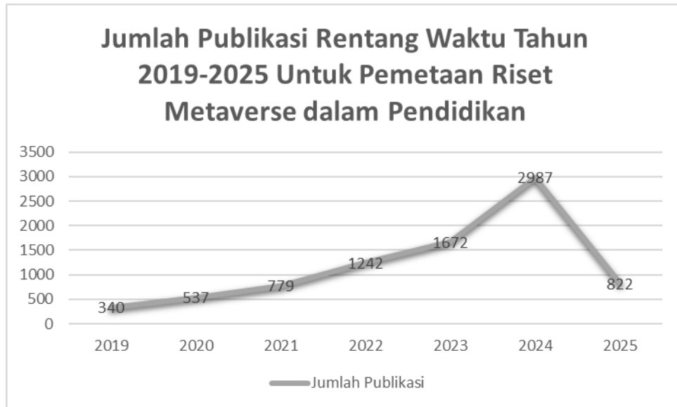
Gambar 1 Grafik Publikasi Tahunan Riset Metaverse dalam Pendidikan