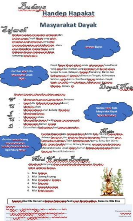
Gambar 2. Revisi Sketsa