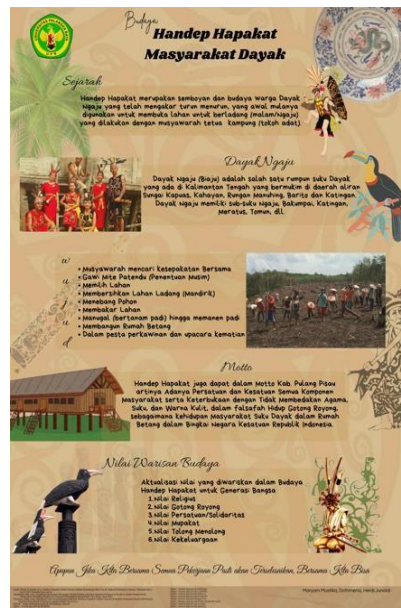
Gambar 3. Desain Akhir Poster