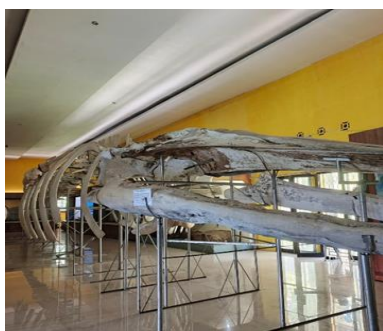
Gambar 1.2 Paus

Museum Siwalima merupakan salah satu lembaga kebudayaan yang sangat penting di Maluku. Terletak di Kota Ambon, Museum ini berada di bawah naungan Dinas Pendidikan dan Kebudayaan Provinsi Maluku. Hingga saat ini, Museum Siwalima menjadi satu-satunya Museum provinsi yang mewakili identitas Sejarah dan Budaya Maluku. Keberadaannya tidak hanya berfungsi sebagai tempat penyimpanan benda-benda bersejarah, tetapi juga sebagai pusat edukasi, penelitian, dan pengembangan nilai-nilai Budaya bagi masyarakat lokal maupun mancanegara.