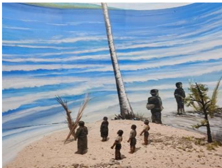
Gambar 1.6 Sasi

Museum juga mengadakan berbagai kegiatan kreatif, seperti lomba vlog dan lomba literasi yang bertujuan memperkenalkan koleksi Museum kepada generasi muda melalui media yang sesuai dengan perkembangan zaman. Melalui kegiatan tersebut, Museum berhasil menanamkan kesadaran Budaya dengan cara yang lebih menarik dan relevan bagi anak-anak muda.