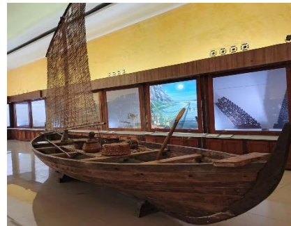
Gambar 1.7 Perhu/Koli-Koli

Sasi adalah larangan yang bersifat sementara untuk mengambil hasil di hutan maupun laut. Tujuannya adalah untuk meningkatkan produksi, pelestarian lingkungan, dan meningkatkan pendapatan masyarakat. Museum Siwalima juga sering menggelar pameran keliling di kabupaten/kota yang sulit menjangkau Ambon karena kendala transportasi. Pameran keliling ini memungkinkan masyarakat di daerah terpencil untuk mengenal koleksi Museum dan memahami nilai Budaya leluhur. Dengan demikian, Museum berperan aktif dalam mendekatkan Sejarah dan Budaya kepada masyarakat luas.