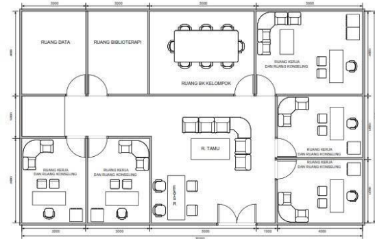
Gambar 1. Contoh Gambar Desain Ruang BK I

furnitur yang fleksibel dan penggunaan elemen dekoratif minimalis, yang mendukung privasi sekaligus kenyamanan psikologis konseli. Kedua gambar tersebut merepresentasikan penerapan prinsip desain ruang BK yang adaptif dan realistis untuk konteks pendidikan nonformal.