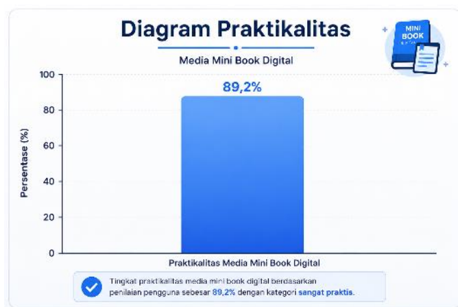
Gambar V. Diagram Hasil Uji Praktikalitas

Berdasarkan Tabel 3, aspek ketertarikan media memperoleh nilai paling rendah dibandingkan aspek lainnya. Namun, ketiga aspek tetap berada pada kategori sangat praktis. Dengan demikian, mini book digital untuk peminatan dan perencanaan individual dinyatakan sangat praktis untuk digunakan siswa dalam mendukung layanan BK di sekolah. Meskipun demikian, produk masih memiliki keterbatasan, yaitu hanya dapat diakses menggunakan jaringan internet dan belum dapat digunakan secara luring.