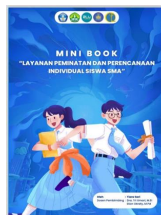
Gambar II. Cover Mini Book Digital

Perancangan instrumen dilakukan dengan menyusun lembar validasi ahli media, lembar validasi ahli materi, dan lembar praktikalitas siswa. Instrumen tersebut digunakan untuk menilai kualitas media dari aspek kegrafikan, kelayakan isi, penyajian, bahasa, kemenarikan, dan kemudahan penggunaan