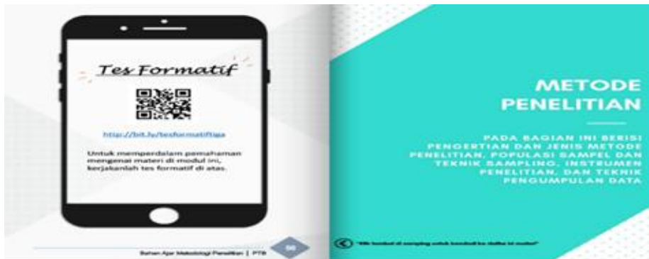
Gambar 4. Tampilan Tes Formatif