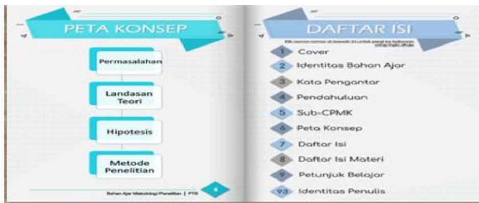
Gambar 2. Tampilan Peta Konsep dan Daftar Isi

Berdasarkan tabel di atas, hasil validasi ahli materi sebesar 0,94 dan kriteria validitas sesuai indeks Aiken's V termasuk ke dalam kategori "sangat tinggi" yang berada di rentang ( 0,8 < V \leq 1,00 ), sementara hasil validasi ahli media sebesar 0,89 dan kriteria validitas sesuai indeks Aiken's V termasuk ke dalam kategori "sangat tinggi" yang berada di rentang ( 0,8 < V \leq 1,00 ). Penilaian yang diberikan cenderung konsisten sehingga validitasnya dapat dipertanggungjawabkan dan produk modul elektronik layak digunakan. Berikut adalah contoh tampilan modul elektronik yang telah dibuat.