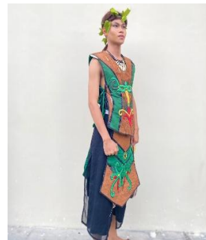
Gambar 4 Busana Pohon. Islamiyah 2025