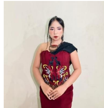
Gambar 1 Busana Putir Busu. Islamiyah 2025 Gambar 2 Busana Bawi Sandah. Islamiyah 2025

Rancangan busana dirancang langsung oleh tim artistik dengan tema busa konu Masyarakat suku Dayak Ngajuk Kalimantan. Pada tokoh Putir Busu dan Bawi sandah serta warga Perempuan yaitu menggunakan kemben dan rok dengan motif khas suku Dayak, tokoh jagao, kakek, serta warga laki-laki yaitu menggunakan sangkarung dan ewah, sedangkan busana pada Umai dan Nenek Ajaib yaitu menggunakan kebaya. warna-warna yang digunakan juga memiliki makna tertentu seperti warna pada tokoh Umai, Nenek, dan Putir Busu warna busana yang digunakan yaitu kuning dan putih dimana warna tersebut melambangkan sebuah kehangatan keceriaan dan kesucian, sedangkan pada Bawi sandah warna yang digunakan yaitu berwarna merah dimana melambangkan sebuah keberanian dan keangguhan, warna pada tokoh Jagao dan Kakek hanya menyesuaikan dengan tokoh Putir Busu dan Bawi Sandah.