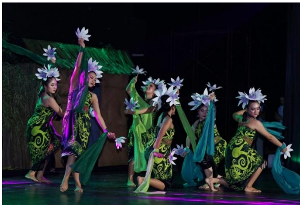
Gambar 5 Penari Kambang Kemot.

Selain itu, pementasan didukung oleh tim atau crew berjumlah 11 orang untuk memastikan kelancaran acara. Pementasan ini juga mendapat dukungan (support) dari Sanggar Dandang Tingang, Sanggar Hagatang Tarung, Sanggar Ruang Bahalap Taheta, UPT Taman Budaya Kalimantan Tengah, serta bantuan dari mahasiswa Pendidikan Sendratasik Universitas Palangka Raya. Pertunjukan ini merupakan sebuah jenis pertunjukan sendratari fantasi tradisi dengan nuansa fantasi akan tetapi tetap memiliki unsur tradisi masyarakat Kalimantan Tengah agar tetap dapat melestarikan budaya. Selain itu penulis juga Mendokementasikan karya seni Sendratari Putir Busu dan Bawi Sandah sebagai berikut: